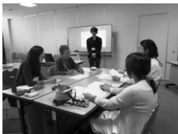
5/13 「やりたいことのみつけかた」